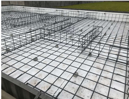
▲ 基礎の外周と底面に50mmの断熱材を施工したところ。白く見えるのが断熱材。