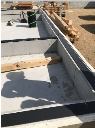
▲ 基礎の外周上に気密を保つために厚さ6mmのパッキングを施工したところ。黒く見えるのがパッキング。