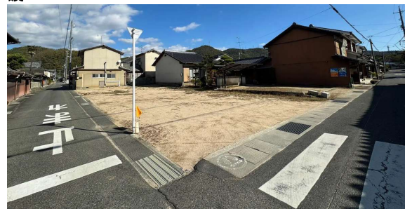
敷地は平坦。遠くには山並みが綺麗に見えます。

ビンゴ大会に美味しいスイーツや軽食をご用意！盛りだくさんの1日です！ぜひご来場ください！