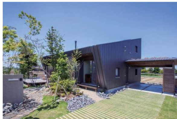
高岡氏の自宅 パッシブハウス 基本設計パッシブハウスジャパン代表森みわ

※パッシブハウスについて詳しくはこちらを参照くださいませ。 https://passivehouse-japan.org/ja/